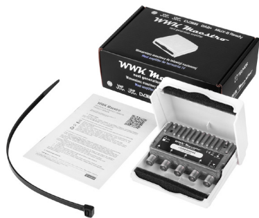
WZMACNIACZ WWK MAESTRO