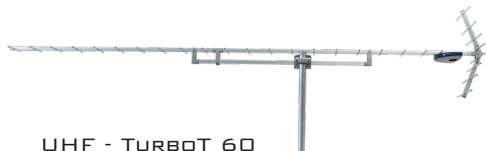
UHF - TURBOT 60