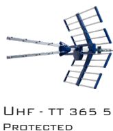
UHF - TT 365 5G PROTECTED