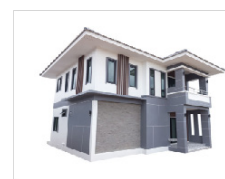
INSTALACJE DOMOWE I MAŁE ZBIORCZ