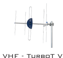
VHF - TURBOT V